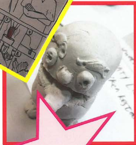
Oppilastöiden kuvat: Yhtenäiskoulun opettajat ja oppilaat